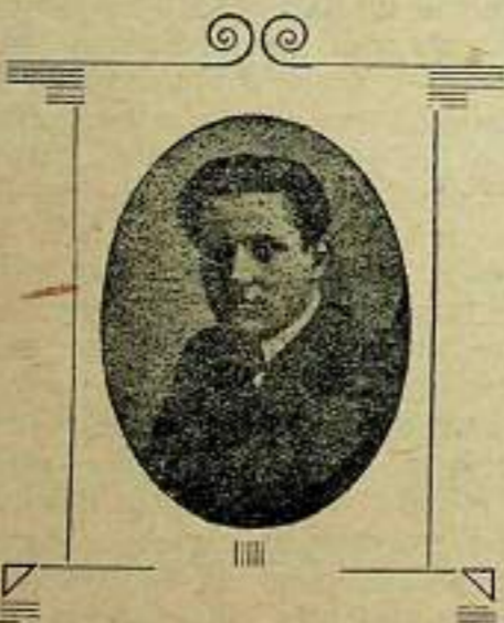
ЕДИН НЕУМОРИМ ДЕЕЦ.

Това са те, малките наши нововъведения. Ние не губим надежда, че след тяхното пълно прокарване ще дойдат и други — по-съществени и належащи: ще дойде премахването на гибелните за ученика бележки , ще дойде изхвърлянето на в нищо непотребната матура и т. н. — но сега за сега нека с радост се заемем да помогнем за турянето в сила и на тия нововъведения и възторжно да администрираме новите си американски училища .