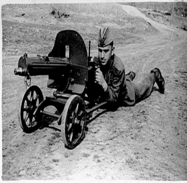
В казармата, гр. Пловдив, 1960г.