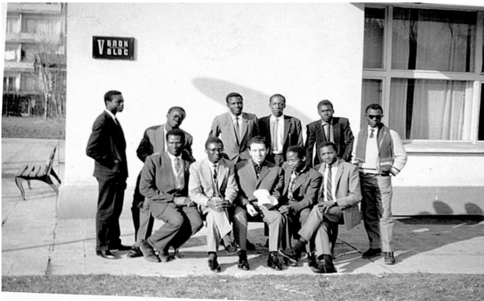
С колеги от Университета, гр. София, 1963г.