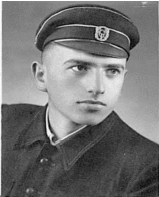
Ученик в Гимназията, гр. Самоков.