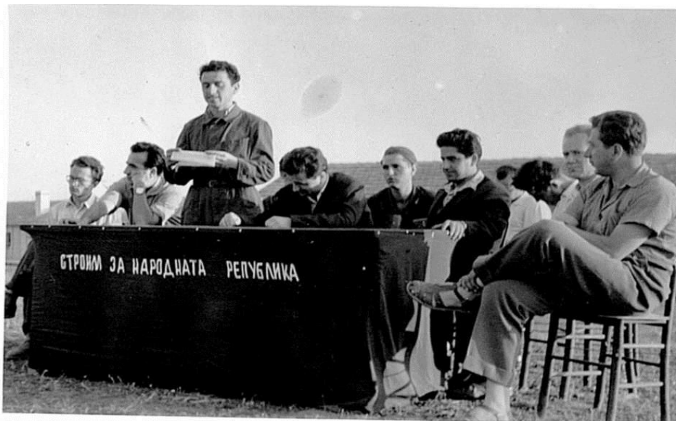
Четене на стихове в Кремиковци, 1964 г.